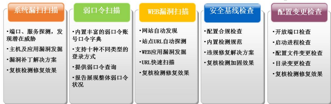
图片说明 1 五大引擎特性

聚铭网络脆弱性扫描系统，协助用户完成企业内安全脆弱性问题的发现、分析、加固指导等工作。它主要包括五大引擎：