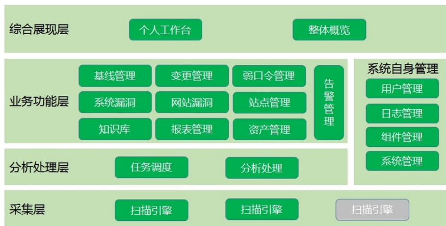
图片说明 2 技术架构